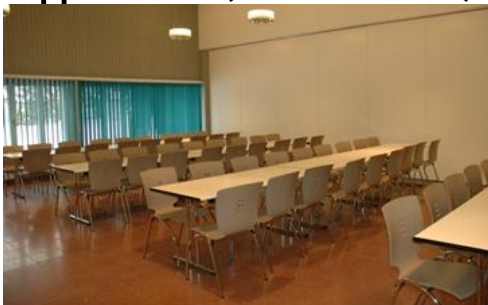
Wildbach-Saal (mit Trennwand)