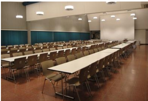
Luppmen-Saal (mit Trennwand)

Der Luppmen-Saal befindet sich im Erdgeschoss des Heiget-Huus und kann als moderner Konzert- und Festsaal genutzt werden. Zudem verfügt der Saal über eine grosse Küche mit Ausschankbuffet und Geschirr- und Bestecksätzen für 200 Personen. Es besteht die Möglichkeit, den Saal mit einer Trennwand zu unterteilen.