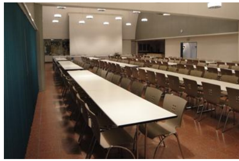
Luppmen-Saal (ohne Trennwand)